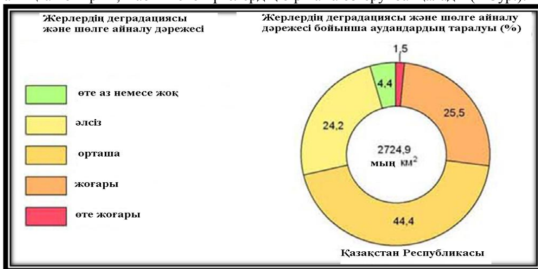
1 Сур. – Қазақстан аудандарының шөлдену дәрежесі бойынша аралуы

Дегенмен, қазіргі уақыттағы ауыл шаруашылығы өндірісінің қарқынды жүргізілуіне және техникалық ықпалдың артуына (әсіресе, пайдалы қазбаларды барлау және өндіру) байланысты, және де климаттың айтарлықтай өзгеруімен байланысты шөлдену дәрежесі мен қарқынын анықтай отырып, табиғи экожүйелердің біршама өзгеруі байқалады (1 Сур.).