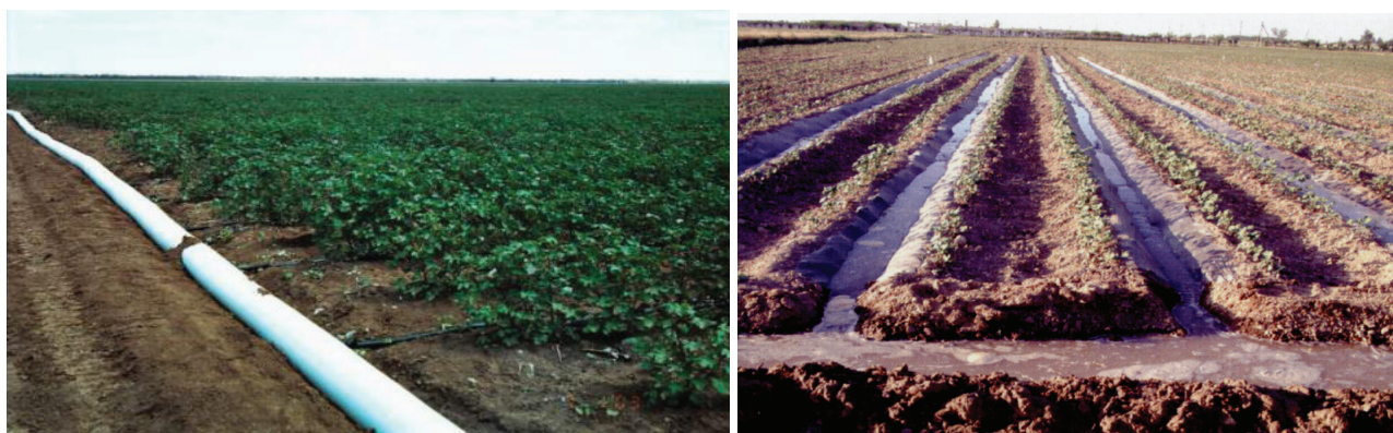
Полив с помощью гибких шлангов и полив через плёнку. Применяются уже на более 2,0 тыс. га орошаемых земель отведенных под выращивание хлопчатника.

В период с 2013 по 2018 годы землепользователям и фермерским хозяйствам за счет государства будут предоставляться на льготной основе долгосрочные 5%-ные кредиты для внедрения системы ка-