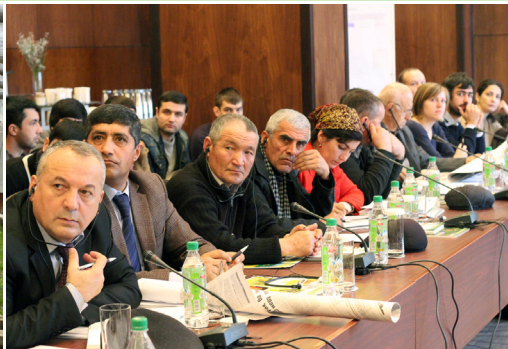
Лесники из Кыргызстана и Таджикистана обсуждают выращивание саженцев в лесопитомнике в Иссык-Кульской области, Кыргызстан.