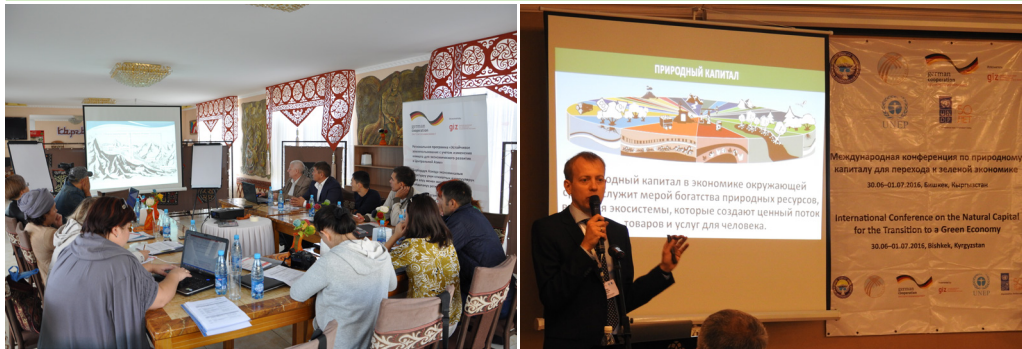
Тренинг по адаптации к изменению климата для представителей СМИ. Бишкек, Кыргызстан.