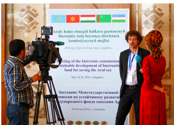
Участники семинара по совместному управлению лесами в Яккабагском лесхозе Кашкадарьинской области, Узбекистан.