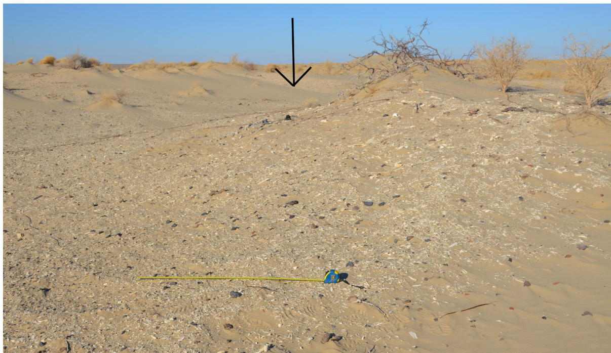
Сур. 3. Үрген қонысы. 2019 ж. Fig. 3. Urgen settlement. 2019.