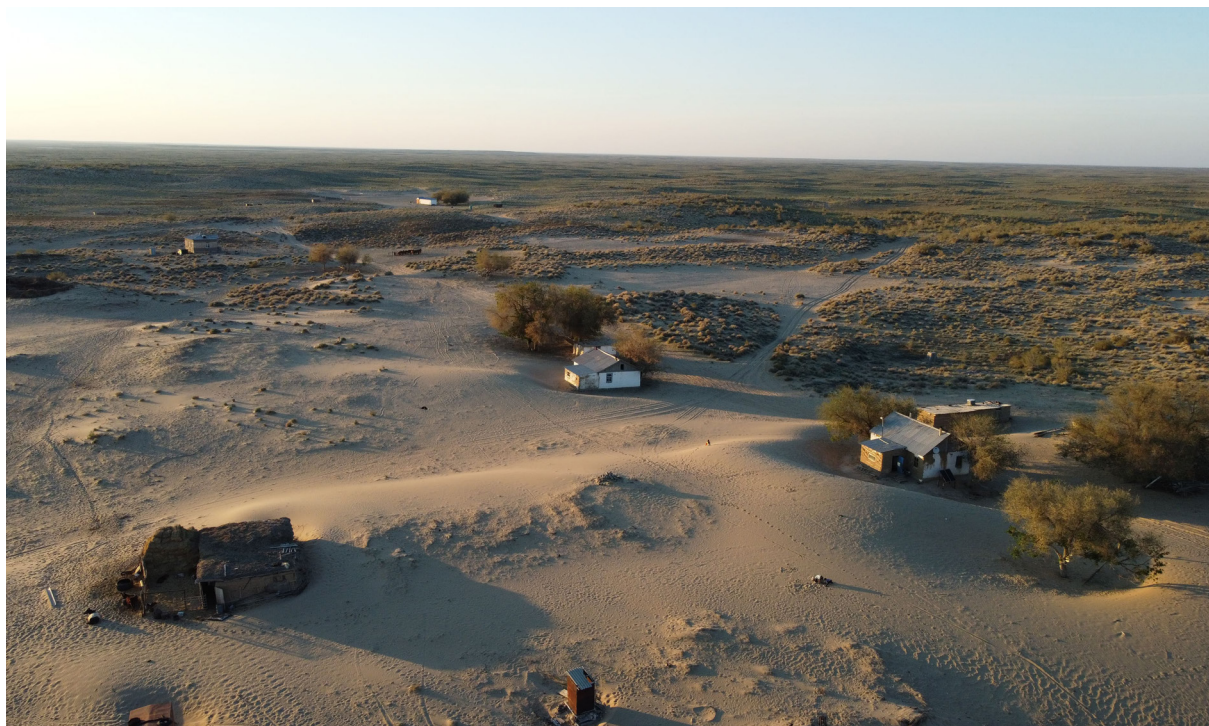
Сур. 4. Арал маңы Қарақұмы Тапа ауылы мен қола дәуірі қонысы әуеден көрінісі. 2023 ж. Fig. 4. Aerial view of Tapa village and the settlement of the Bronze Age on Aral Karakum. 2023.