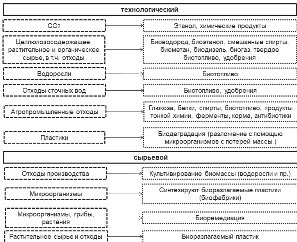
Рис. 4. Сложившиеся тенденции в применении двух основных подходов по использованию биотехнологий для «зелёной» экономики

не востребуемые ресурсы с получением хозяйственно-ценных побочных продуктов (то есть обеспечивать замкнутый цикл производства), так и формировать специфический промышленный симбиоз [16]. Считается, что промышленный симбиоз формируется как особое направление в организации хозяйственной деятельности и предполагает развитие объединений хозяйствующих субъектов для достижения конкурентного преимущества через обмен материалами, побочными и другими продуктами с целью последующей переработки.