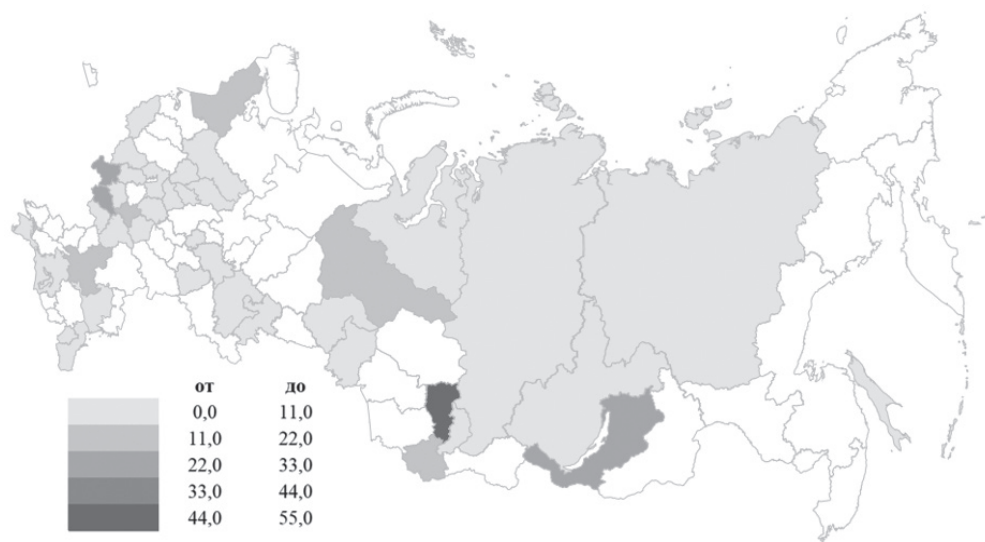
Рис. 5. Результаты лексикометрического анализа стратегий социально-экономического развития субъектов Российской Федерации

Для оценки состояния «зелёной» экономики в отдельных регионах России был проведен лексикометрический анализ (по [7]) для определения частоты встречаемости соответствующих ключевых слов 2 . Анализом были охвачены актуальные стратегии социально-экономического развития 85 субъектов Российской Федерации. Полученные результаты представлены на Рис. 5. В целом выбранные ключевые слова были обнаружены в 44 из 85 проанализированных стратегий.