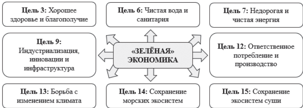
Рис. 1. Ожидаемое участие «зелёной» экономики для достижения отдельных целей устойчивого развития

резолуция содержала формулировки семнадцати целей («Цели в области устойчивого развития»), достижение которых могло бы снизить существующие проблемы, связанные с высокой антропогенной нагрузкой на окружающую среду. Предполагалось, что для ряда обозначенных целей требовалось формирование «зелёной» экономики (рис. 1).