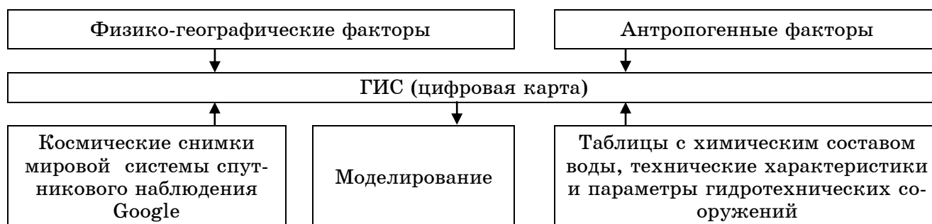
Рис. 1. Блок-схема системы гидроэкологического мониторинга бассейна Аральского моря

Качество воды реки Амударьи и Сырдарьи обусловлено как природными, так и антропогенными факторами.