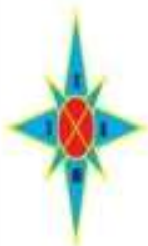
СХЕМА ПАСТБИЩЕОБОРОТОВ НА ОСНОВАНИИ ГЕОБОТАНИЧЕСКОГО ОБСЛЕДОВАНИЯ ПАСТБИЩ В АДМИНИСТРАТИВНЫХ ГРАНИЦАХ ГОРОДА КОКШЕТАУ