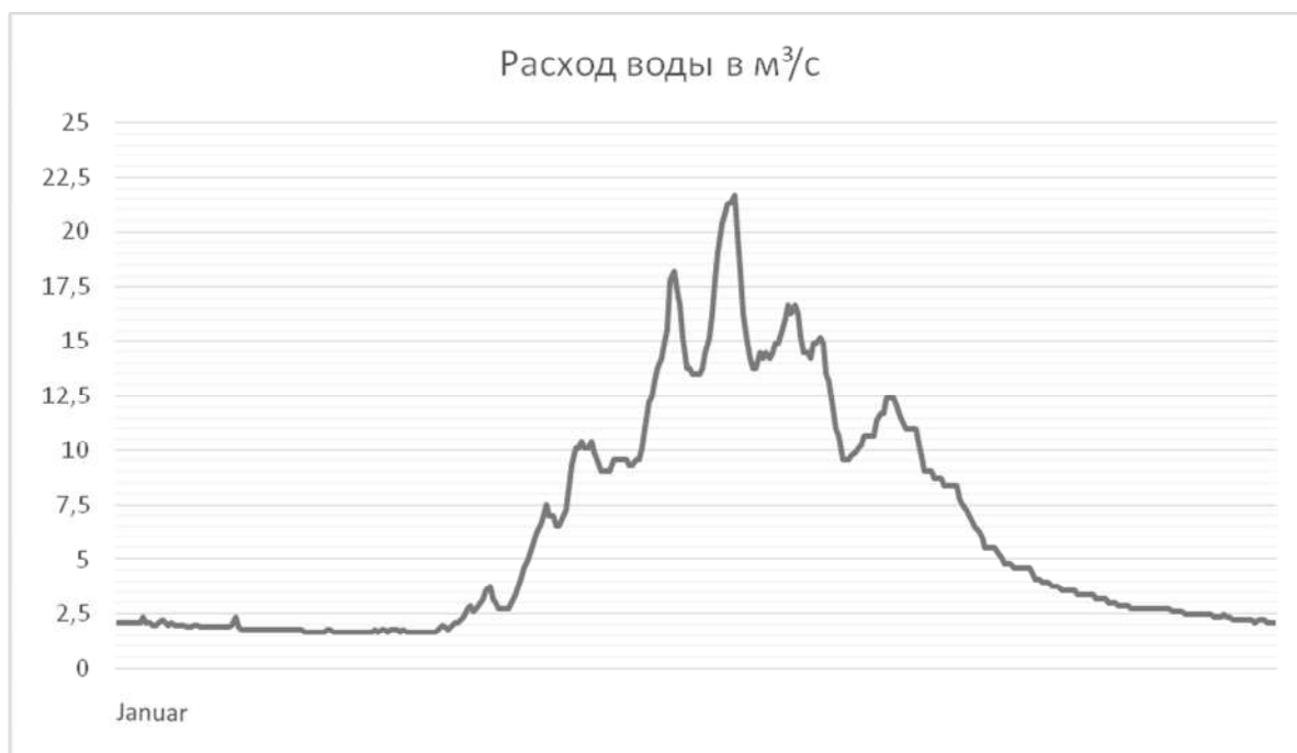
Рис. 4. Гидрограф реки Аламедин за 2017 год

При этом в период половодья увеличение расхода может быстро смениться значительным снижением, и наоборот, причем эти изменения носят случайный характер. Все это может существенно снижать точность измерений и даже приводить к отказу системы, что потребует частого ремонта, дополнительной периодической настройки и калибровки аппаратуры.