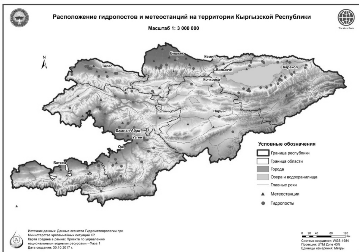
Рис. 1. Карта расположения гидропостов на территории Кыргызской Республики

В 2018 году в Кыргызском государственном техническом университете (КГТУ) имени И. Раззакова совместно с Агентством по гидрометеорологии начаты работы по созданию сети автоматизированных гидропостов для решения следующих задач: 1) быстрого оповещения о разливах горных рек и горных озер, призванного заполнить недостающую нишу краткосрочного оперативного прогнозирования опасных гидрологических явлений; 2) повышения точности учета расхода и стока речной воды с целью оптимизации ее использования в народном хозяйстве.