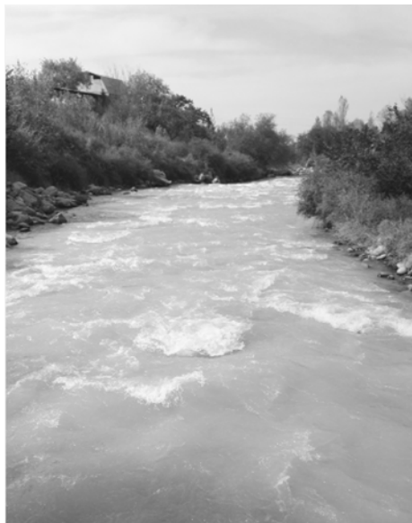
Рис. 3. Река Аламедин

При этом в период половодья увеличение расхода может быстро смениться значительным снижением, и наоборот, причем эти изменения носят случайный характер. Все это может существенно снижать точность измерений и даже приводить к отказу системы, что потребует частого ремонта, дополнительной периодической настройки и калибровки аппаратуры.