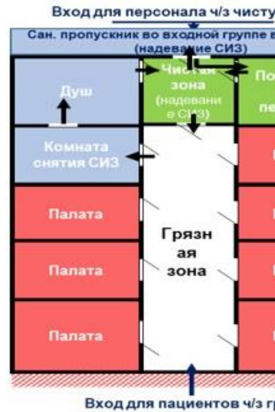
Схема модульного инфекционного стационара