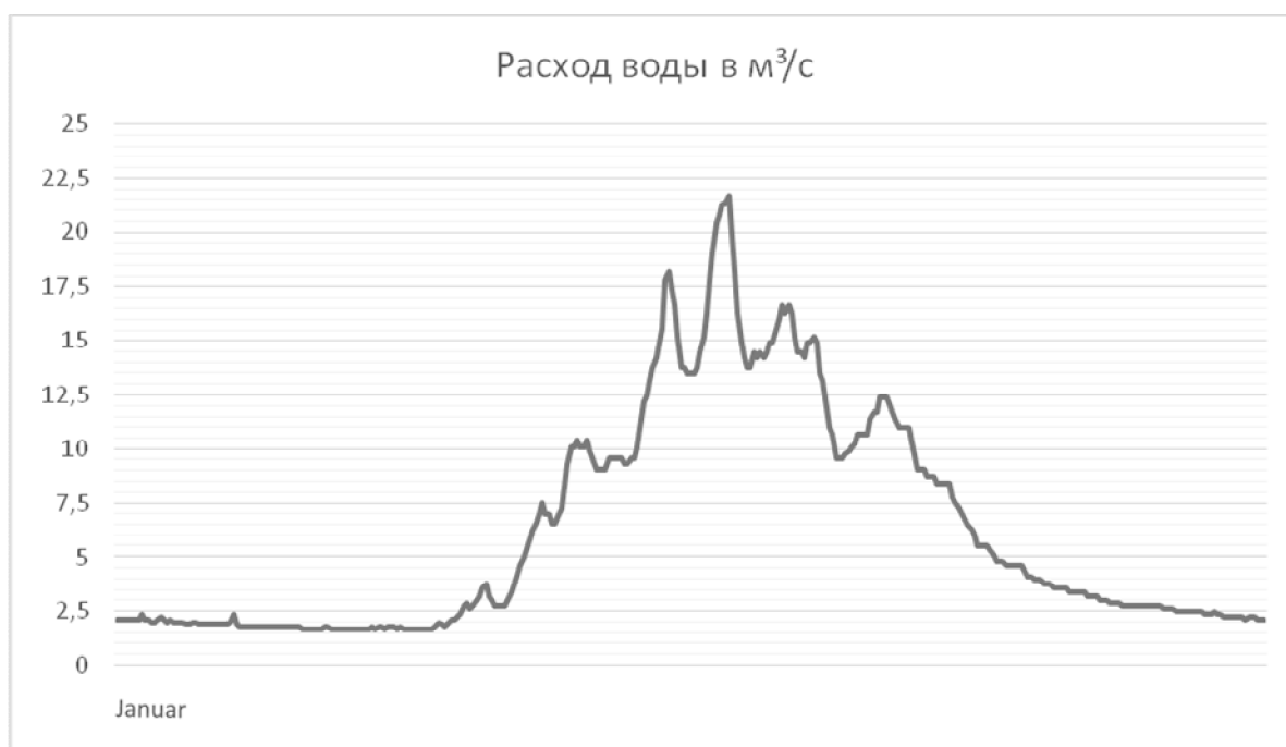
Рис. 4. Гидрограф реки Аламедин за 2017 год

При этом в период половодья увеличение расхода может быстро смениться значительным снижением, и наоборот, причем эти изменения носят случайный характер. Все это может существенно снижать точность измерений и даже приводить к отказу системы, что потребует частого ремонта, дополнительной периодической настройки и калибровки аппаратуры.