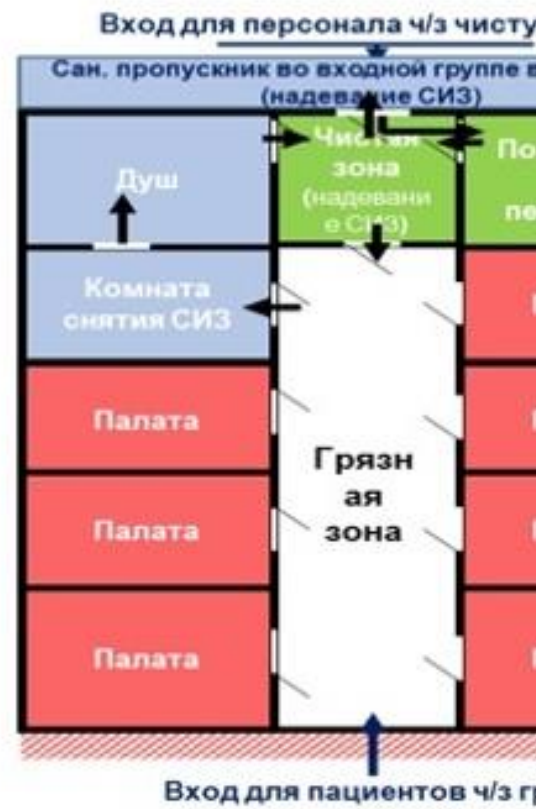
Схема модульного инфекционного стационара