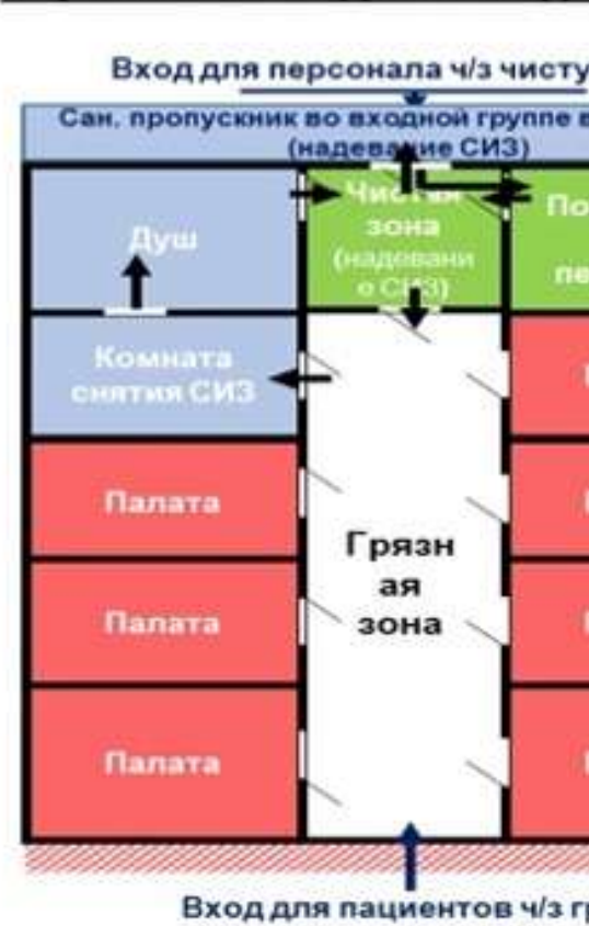
Схема модульного инфекционного стационара