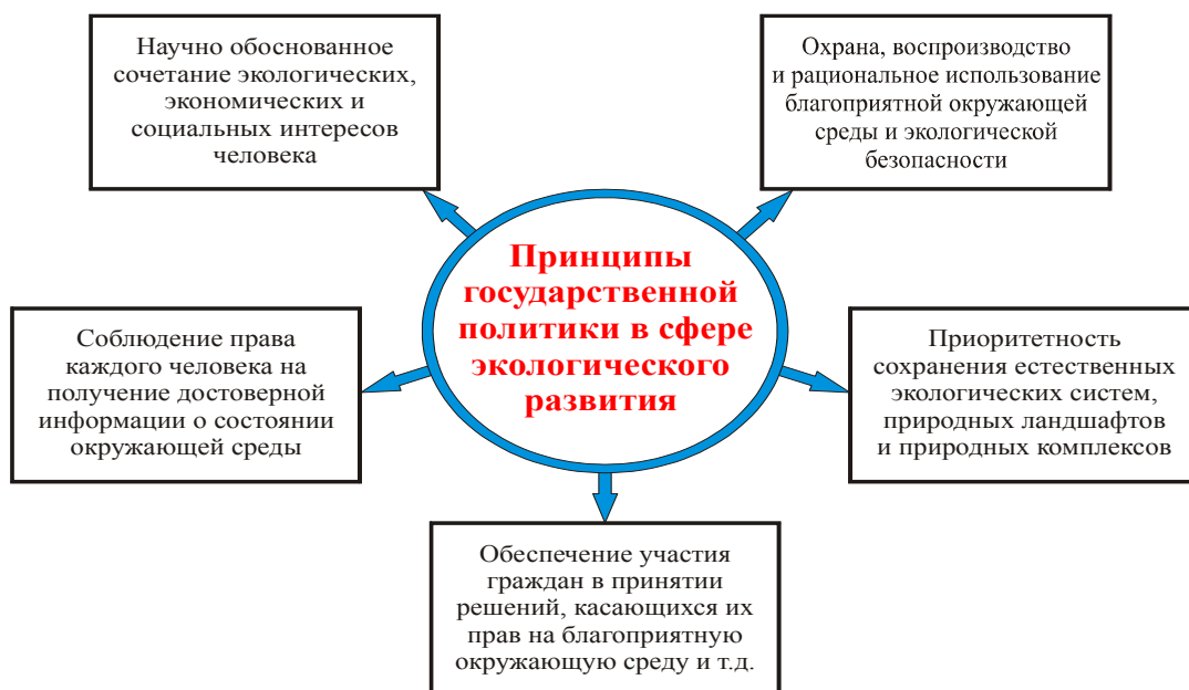
Рисунок 2. Принципы государственной политики в сфере экологического развития.