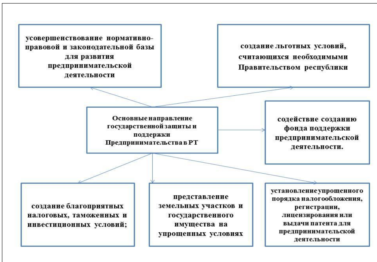
Рисунок 1. Основные направления государственной защиты и поддержки предпринимательства в Республики Таджикистан.

представляющих интересы сектора малого предпринимательства, финансовые ресурсы не всегда доступны, а если доступны, то связаны с немалыми затратами [7].