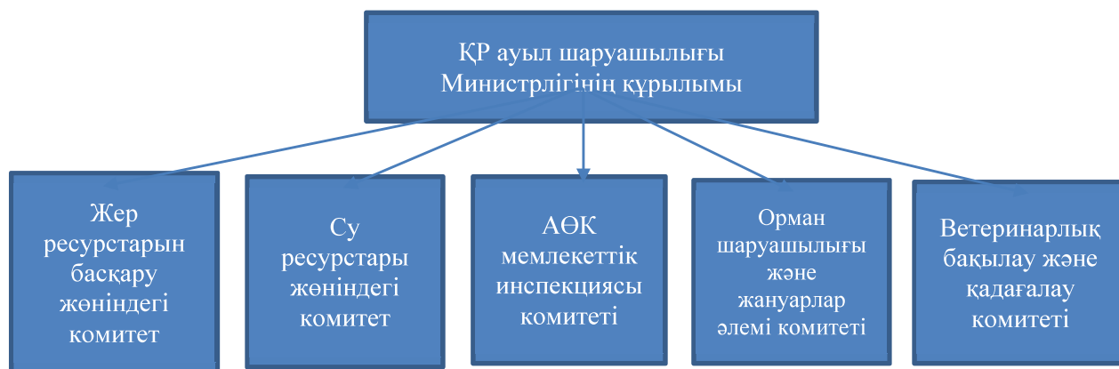
Сурет 1- Қазақстан Республикасы ауыл шаруашылығы Министрлігінің құрылымы

Қазақстан Республикасы ауыл шаруашылығы Министрлігінің қазіргі құрылымы бойынша ауыл шаруашылығының даму бағыттары келесідей: Экспорт-импорт; Ветеринарлық қауіпсіздік; Фотосанитарлық қауіпсіздік; Қазақстанның АӨК; Мал шаруашылығы; Өсімдік шаруашылығы; Өңірлердегі АӨК дамуын басқару; АӨК цифрландыру; Орман шаруашылығы және жануарлар әлемі; Ғылым және инновация; Мемлекеттік саяси шаралар; Жеке кәсіпкерлік субъектілерін тексеру; Ауыл – ел бесігі [6].