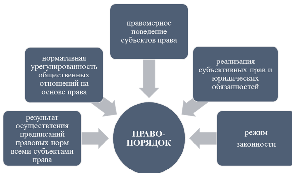
Рисунок 2. Понимание правопорядка

В учебнике Борисова Г.А. правопорядок определяется «как состояние правовой упорядоченности социальных связей, которое формируется вследствие фактической реализации правовых предписаний (установлений) в результате осуществления принципа законности» [4]. Здесь правопорядок рассматривается как состояние правовой урегулированности социальных связей; либо как правовая модель упорядоченности, соответствующая интересам людей; либо как результат волевых усилий по осуществлению требований законности [5]. Можно привести множество подходов к определению понятия и содержания правопорядка.