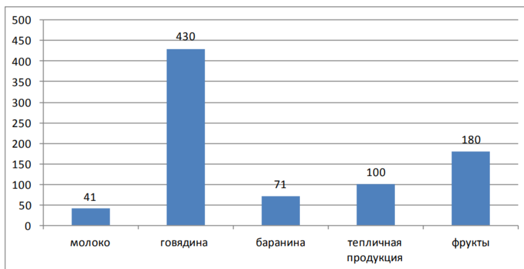
Рис. 3. Планируемое производство продукции сельского хозяйства и пищевой промышленности (тонн/год) в 2027 г

которых 1,0 млн га являются пахотными, 0,4 млн га – орошаемыми; 86 гектаров приходится на тепличные плантации. Прибыль, получаемая с 1 га земли в области, значительно различается по районам в зависимости от природных условий и условий пользования землями. Эксперты подсчитали, что в области существует определенный потенциал для повышения урожайности, что видно из рисунка 3